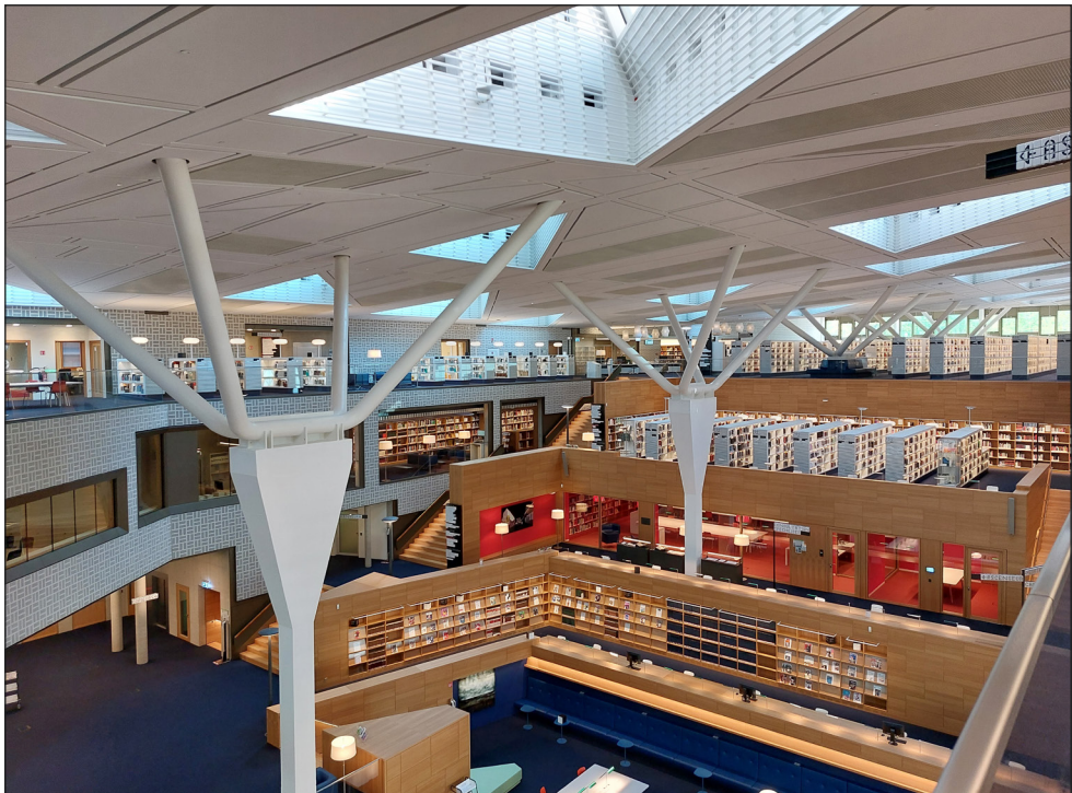
Abb. 3: Nationalbibliothek Luxemburg.

Die Vorträge boten eine große Spannweite von visionären Zukunftsszenarien über begrenzte, konkrete Aufwertungsmaßnahmen existierender Bibliotheksräume bis hin zu Re-Evaluierungen gut genutzter Gebäude, auch hinsichtlich nicht intendierter Effekte, aus denen Andere lernen können.