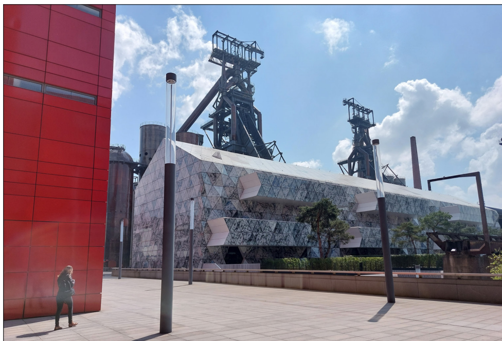
Abb. 2: Fassade des Belval Learning Center.