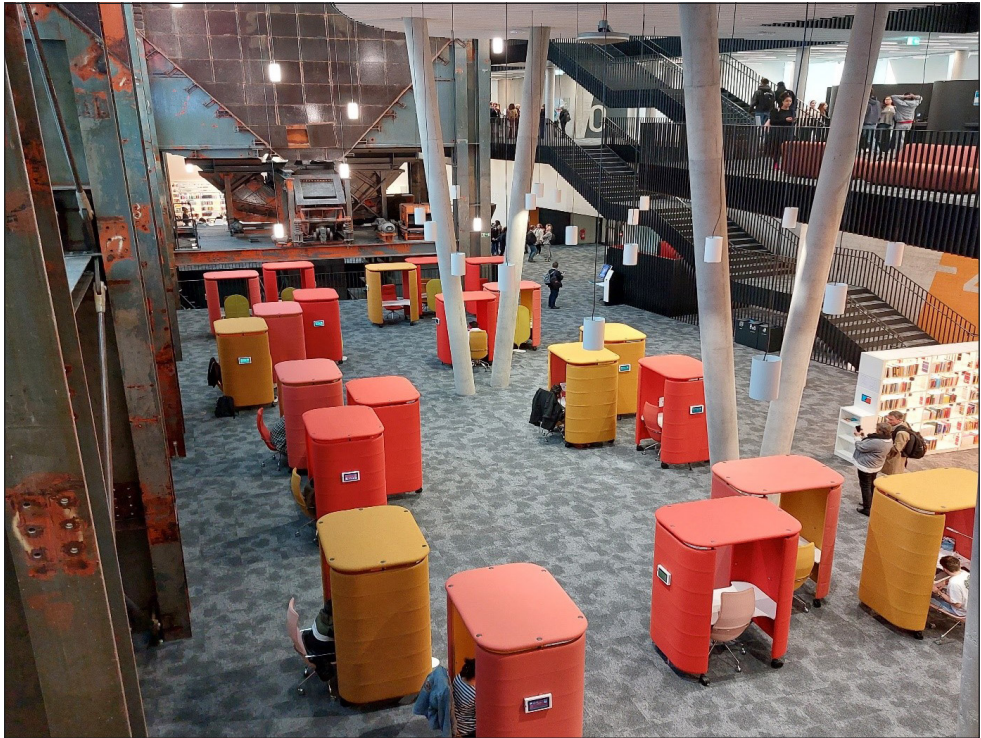
Abb. 5: Buchbare Kabinen als Raum-in-Raum-Lösung für Einzelarbeit oder Teilnahme an digitaler Lehre.