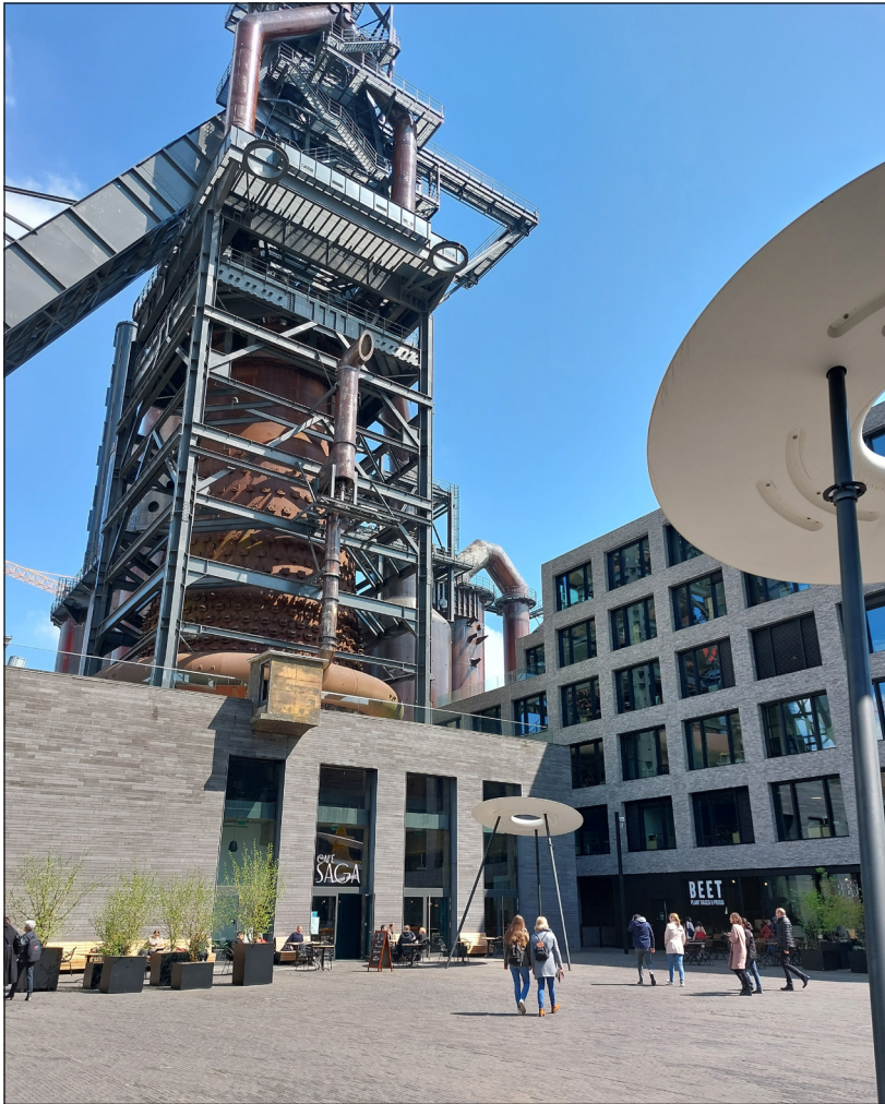
Abb. 1: Impression vom Campus Belval.